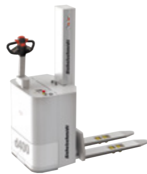
d400 GMP Elektro-Deichsel-Palettstapler

Zum Einlagern, Auslagern, Heben und transportieren von Paletten und Behältern. Fahrzeugchassis mit geschlossener Hubsäule und Edelstahl-Palettgabelträger. Der geschlossene Batterieraum und der in sich geschlossene Hydraulikkreislauf verhindern eine Verunreinigung des Arbeitsbereiches.