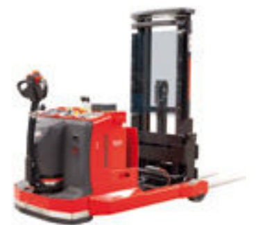
d1200 EEx Schubmaststapler

Mit Tragfähigkeiten bis 1250 kg und Hubhöhen bis 5700 mm lässt sich der d600 EEx im Gefahrgutlager und in anderen Ex-Bereichen hervorragend einsetzen. Die solide Konstruktion sorgt für außerordentliche Standfestigkeit – ein wichtiges Sicherheitsmerkmal.