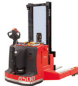
d500 EEx Breitspurstapler

Tragfähigkeit bis 2000 kg Hubhöhe bis 5700 mm