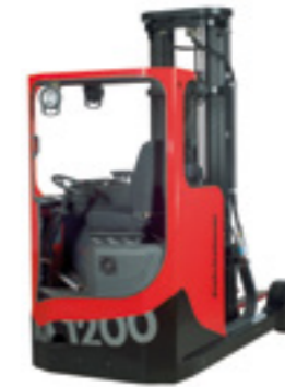
M1200 EEx Schubmaststapler

Tragfähigkeit bis 3000 kg Hubhöhe bis 7500 mm