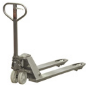
H120 EEx Edelstahl- Handhubwagen

Für horizontalen Transport von Paletten und Behältern bis 2000 kg.