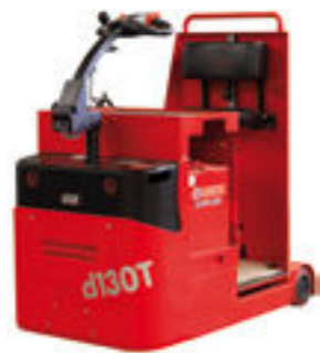
d130-T EEx Elektro-Schlepper

Der d130-T EEx mit einer Zugkraft von 3 Tonnen zeichnet sich durch extrem kompakte Abmessungen aus. Der Stand-Fahrerplatz mit Rückenlehne bietet dem Bediener hohen Komfort auch auf längeren Fahrstrecken.