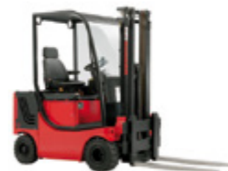
M700-4 EEx Vierrad-Gabelstapler

Tragfähigkeit bis 2000 kg Hubhöhe bis 6000 mm