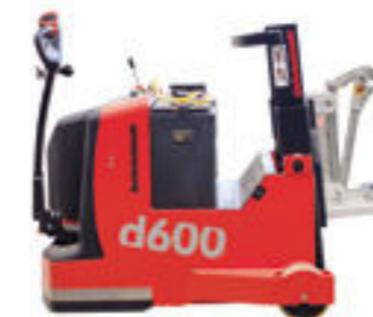
d600 EEx Gabelstapler

Tragfähigkeit bis 2000 kg Hubhöhe bis 5700 mm