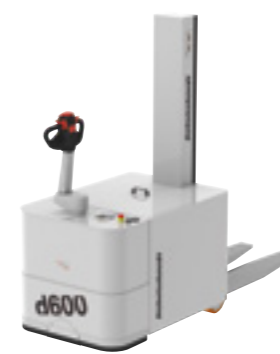
d600 GMP Elektro-Deichsel-Gabelstapler

Zum Transportieren von Paletten und Behältern sowie zur Nutzung mit unterschiedlichsten Anbaugeräten. Fahrzeugchassis mit geschlossener Hubsäule, Gabeln und Gabelträger aus Edelstahl. Der geschlossene Batterieraum und der in sich geschlossene Hydraulikkreislauf verhindern eine Verunreinigung des Arbeitsbereiches.