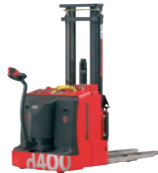
d400 EEx Palettstapler

Wenn es um den horizontalen Transport von Paletten und Behältern geht, ist der d100 EEx in seinem Element. Mit seinem besonders geringen Eigengewicht hebt er bis zu 3000 kg und kommt auch unter beengten Platzverhältnissen bestens zurecht.