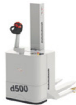
d500 GMP Elektro-Deichsel-Breitspur stapler

Mit hoher Standsicherheit gut unterwegs z.B. beim Fass-Handling – auch im Reinraum. Die Konstruktion des d500 GMP ist bis ins Detail auf den Einsatz in Reinräumen und hygienesensiblen Anwendungen abgestimmt.