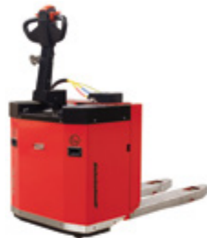
d100 EEx Gabelhubwagen

Für horizontalen Transport von Paletten und Behältern bis 2000 kg.