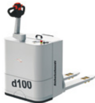
d100 GMP Elektro-Deichsel-Hubwagen

In vielen Prozessen der Pharmaproduktion sind die Anforderungen des Explosionsschutzes zu beachten und die Produktion findet darüber hinaus unter Reinraumbedingungen statt. Damit wird verhindert, dass Fremdstoffe ins Produkt eingetragen werden. Sichelschmidt hat für diese anspruchsvolle Eigenschaftskombination eine eigene Geräteserie entwickelt, die den GMP-Anforderungen entspricht. Diese Reinraum-Stapler werden auch für den Betrieb in Nicht-Ex-Bereichen, z.B. für die Halbleiterindustrie, gefertigt.