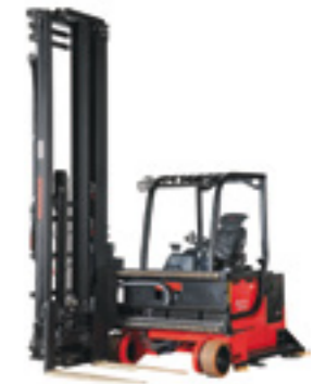
M7200 EEx Schubmaststapler

Seiten-Schubmaststapler als effiziente Lösungen für das Ein- und Auslagern von Paletten. Im Schmalgang kann der Schwenkmast sowohl nach rechts als auch nach links Paletten absetzen bzw. entnehmen.