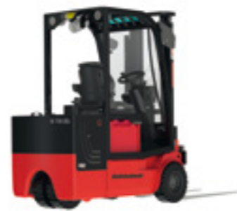
M700-3 EEx Fahrersitz-Gabelstapler

Als kompakter und wendiger 3-Rad Stapler universell einsetzbar. Der leistungsfähige Drehstrom-Vorderradantrieb sorgt mit seinem elektronischen Stabilitätssystem für sichere Fahrt und hohe Umschlagsleistung.