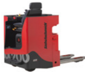
M200 EEx Quersitz-Gabelhubwagen

Der d130-T EEx mit einer Zugkraft von 3 Tonnen zeichnet sich durch extrem kompakte Abmessungen aus. Der Stand-Fahrerplatz mit Rückenlehne bietet dem Bediener hohen Komfort auch auf längeren Fahrstrecken.